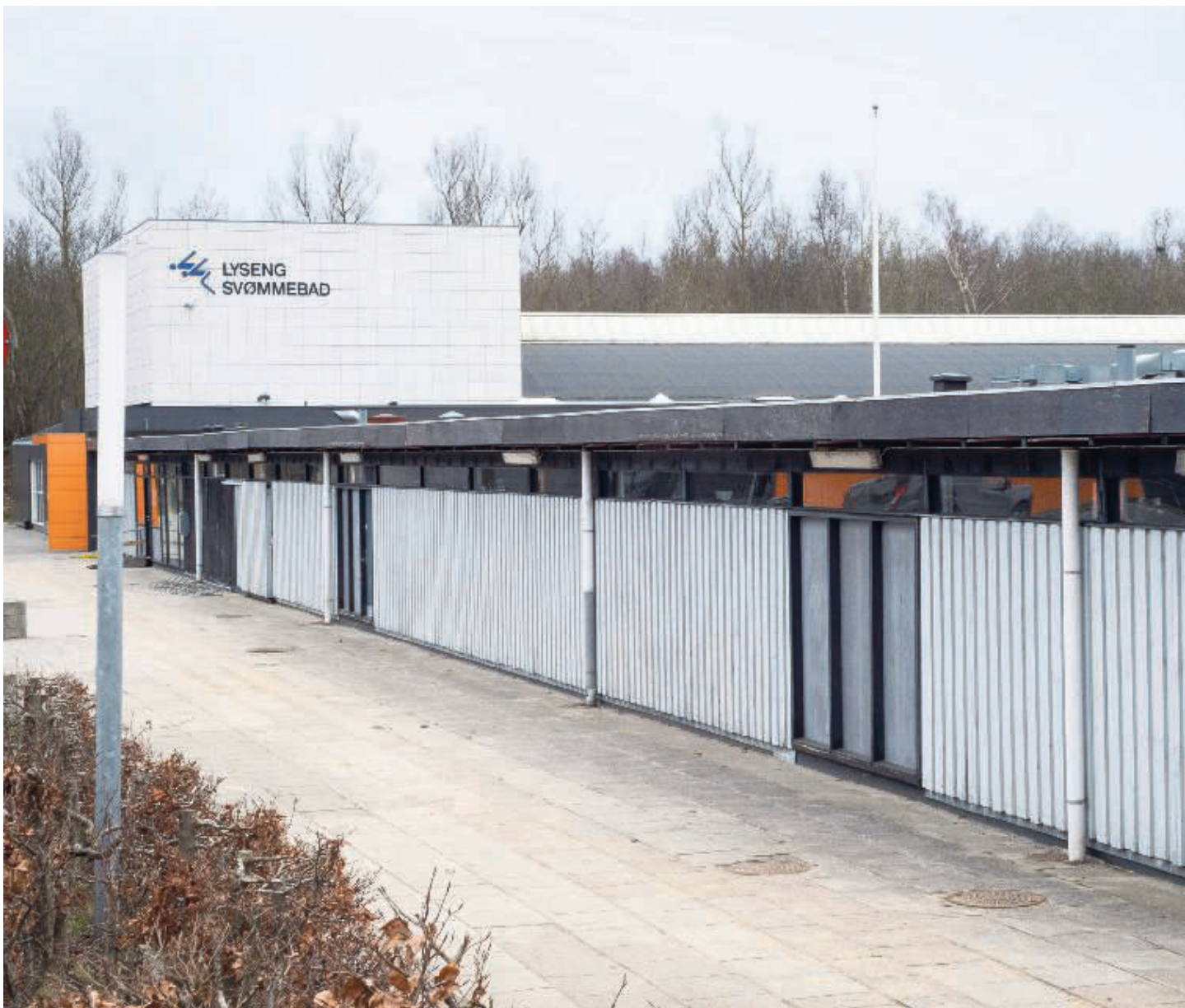
En udvidelse af Lyseng vil give plads til et kampsportscenter samt flere faciliteter til gymnastik og fitness. Samtidig vil der blive bygget lokaler til Højbjerg Bibliotek, borgerservice, medborgerhus og daginstitution.

projektet formes, inden udgangen af juni næste år.