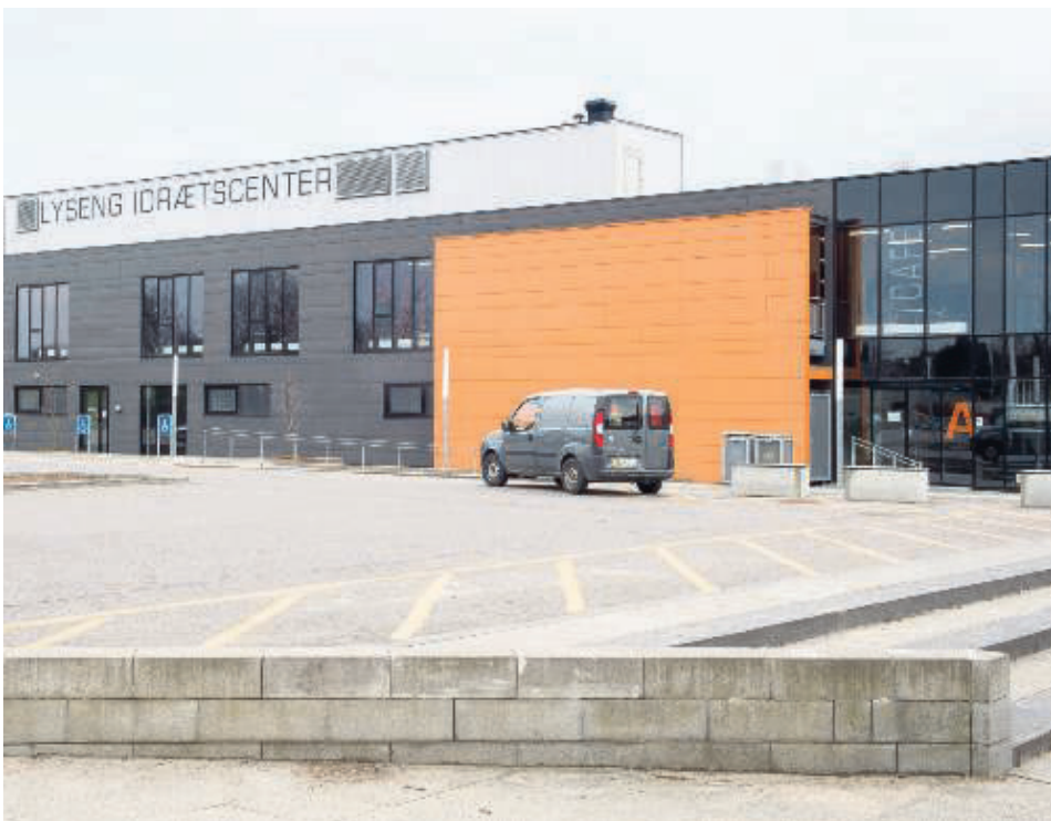
Idrætscenteret ved siden af Lyseng Svømmebad ser idag således ud - og det er det, som lokale foreninger ønsker at udvide.